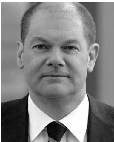
Olaf Scholz, MdB

Integration ist ein Thema, das in Deutschland immer wieder diskutiert wird, mal mehr, mal weniger aufgeregt. Wir brauchen diese Debatte. Denn die Integration der Menschen, die nach Deutschland einwandern oder deren Eltern oder Großeltern eingewandert sind, ist eine Aufgabe, die uns dauerhaft begleitet. Es ist gut, dass nur noch wenige bestreiten: Wir sind eine Einwanderungsgesellschaft, wir brauchen Einwanderung und sie ist ein Gewinn für uns. Aber dies muss immer noch einmal gesagt werden, und es müssen Taten folgen. Dabei sind alle gesellschaftlichen Institutionen gefragt. Deshalb haben