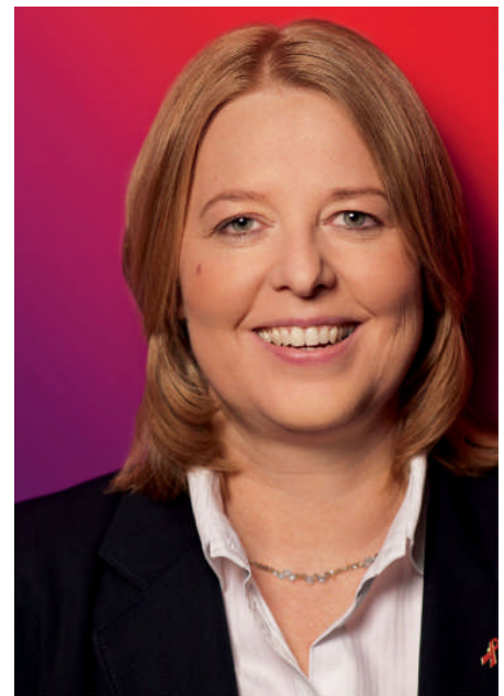
Bis zum nächsten Mal, ich freu mich drauf, Bärbel Bas

Zwischenstand zum Wohnungsgesuch für den Kinder- und Jugendhospizdienst des Malteser Hospizentrums St. Raphael in meiner April-BASis Info: Einige Angebote für die vierköpfige Familie aus Neumühl auf der Suche nach einer barrierefreien 4-Zimmer-Wohnung sind eingegangen. Die Angebote werden gerade geprüft, schon einmal vielen Dank. Weitere Angebote für barrierefreie Wohnungen mit mehr als 2 Zimmern sind übrigens immer willkommen. Diese Familie ist leider kein Einzelfall, die Suche nach einer barrierefreien Wohnung ist für viele Familien in Duisburg sehr schwer.