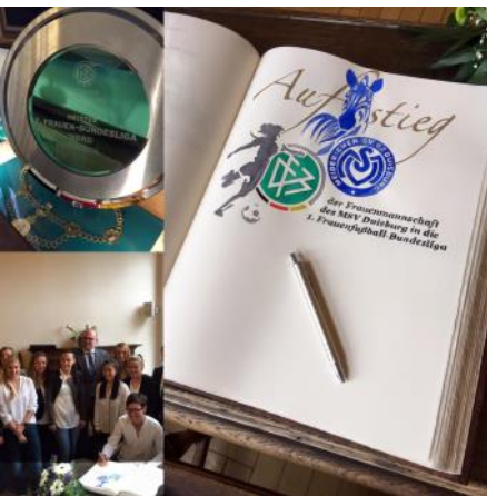
Beim Empfang für die MSV-Frauen im Rathaus.

um einmal mit guten Nachrichten in eigener Sache zu beginnen: Mit 94,2% hat mich die Duisburger SPD am 20. Mai wieder zur stellvertretenden Unterbezirksvorsitzenden gewählt. Vielen Dank für dieses weitere tolle Ergebnis und das große Vertrauen. Das hat mir den Abend gerettet, an dem die MSV-Männer das Relegationsspiel in Würzburg verloren haben. Leider verdient, aber das Projekt Wiederaufstieg läuft und da können sich die Männer bei den MSV-Frauen kräftig was anschauen: 22 Spiele, 22 Siege, mit 75:14 Toren direkt wieder in die 1. Bundesliga durchgaloppiert. Respekt und Glückwunsch.