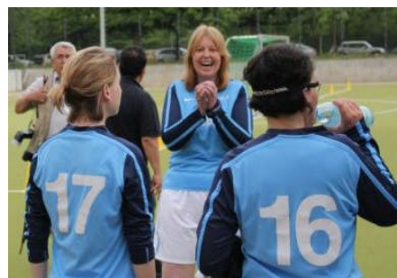
Vor dem Spiel, mehr Fotos gibt's mit einem Klick hier.

Beim DFB-Pokalendspiel konnte ich daher leider nicht mitklatschen. Viel geholfen hätte das aber auch nicht. Das Ergebnis ist schade für das ersatzgeschwächte MSV-