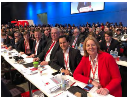
Vollzählig und motiviert: Die Duisburger Delegation

Jetzt liegen viele Optionen für eine Regierungsbildung auf dem Tisch. Jenseits einer Großen Koalition und Neuwahlen bleiben Möglichkeiten, die wir mit viel Gesprächsbereitschaft und ein wenig Phantasie prüfen. Bei unserem Mitgliederparteitag in Duisburg am 2. Dezember hatten wir eine beeindruckend-konstruktive Diskussion. Diese Diskussionskultur haben wir auch vergangene Woche auf unserem Bundesparteitag in Berlin erlebt und ergebnisoffene Gespräche mit der Union beschlossen. Diese haben am Mittwoch begonnen, heute berät der SPD-Parteivorstand.