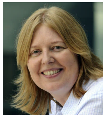
Bis zum nächsten Mal, ich freu mich drauf, Bärbel Bas

Auf meine Pressemitteilung zur 8. GWB-Novelle (s. Seite 2) haben mich einige Bürgerinnen und Bürger angeschrieben. Ein Petent war offenbar so überrascht von meiner Antwort, dass er mich mit einem wirklich netten Kompliment in die Sommerpause schickte: „Vielen Dank für die schnellste Antwort, die ich je von einem MdB erhielt.“