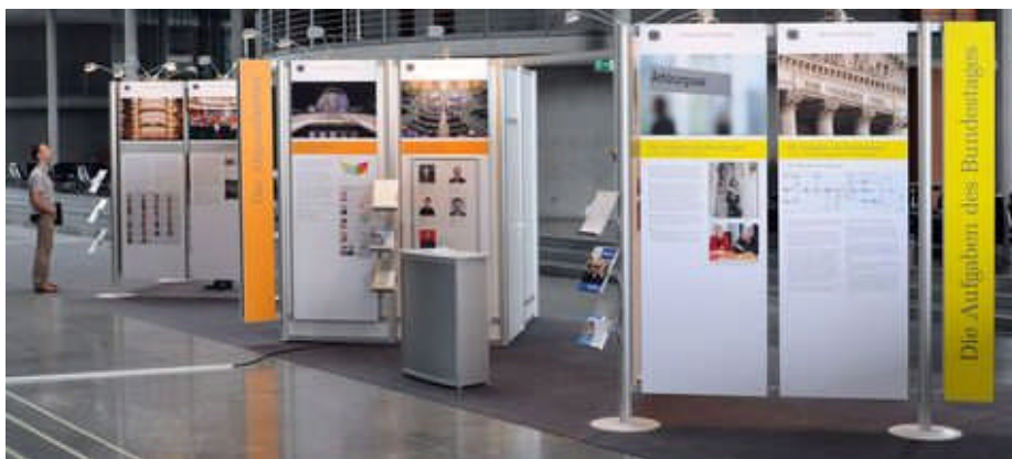
Mit der Wanderausstellung unterstützt der Bundestag bereits seit 1990 den Dialog zwischen Abgeordneten und Bürgern

Die Wanderausstellung des Deutschen Bundestages steht im Foyer der Bezirksbibliothek und kann zu den Öffnungszeiten (Dienstag – Freitag 10-13 und 14-19 Uhr sowie Samstag 10-13 Uhr) besucht werden. Termine außerhalb der Öffnungszeiten können vereinbart werden.